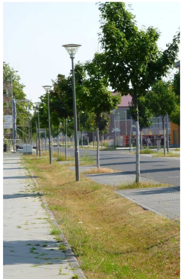
obr. 4 a 5: Príklad stromaradia a príklad vsakovacieho pásu v Berlíne