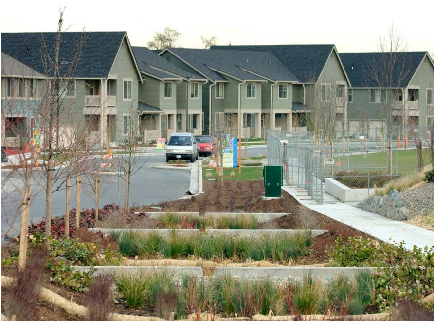
Obr. 2: Príklad retenčných plôch v HighPoint v USA