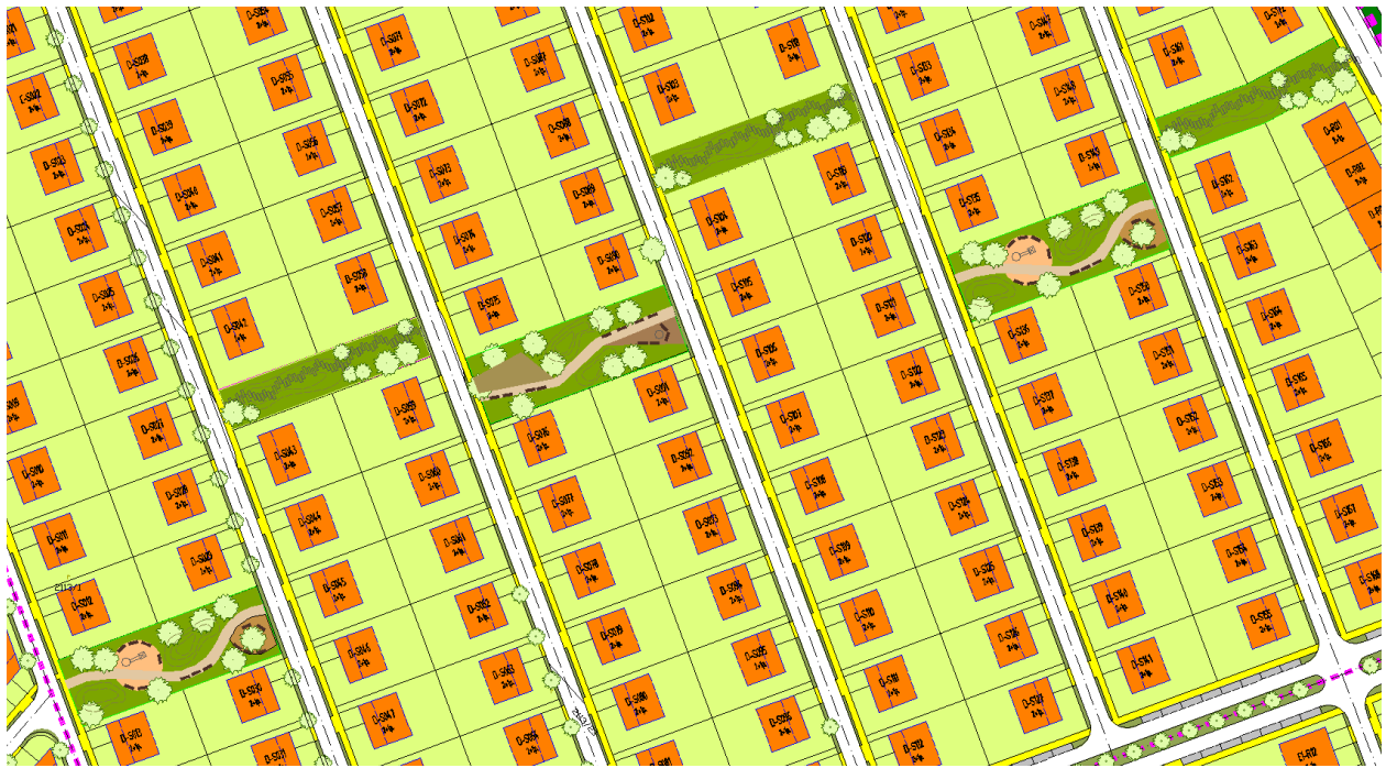
Obr. 3: Príklad riešenia sústavy menších plôch zelene v severovýchodnej časti územia, tzv „pocket park“