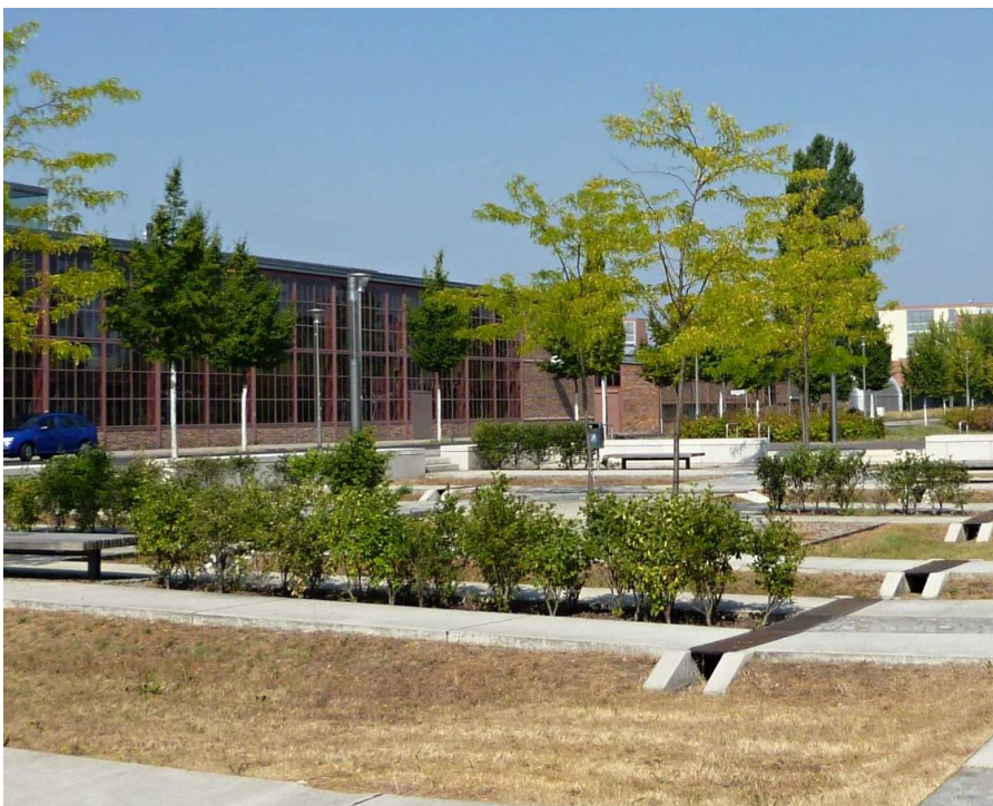
Obr. 1: Príklad retenčných plôch v novo založenom parku v Berlíne (foto T. Reháčková, 2013)