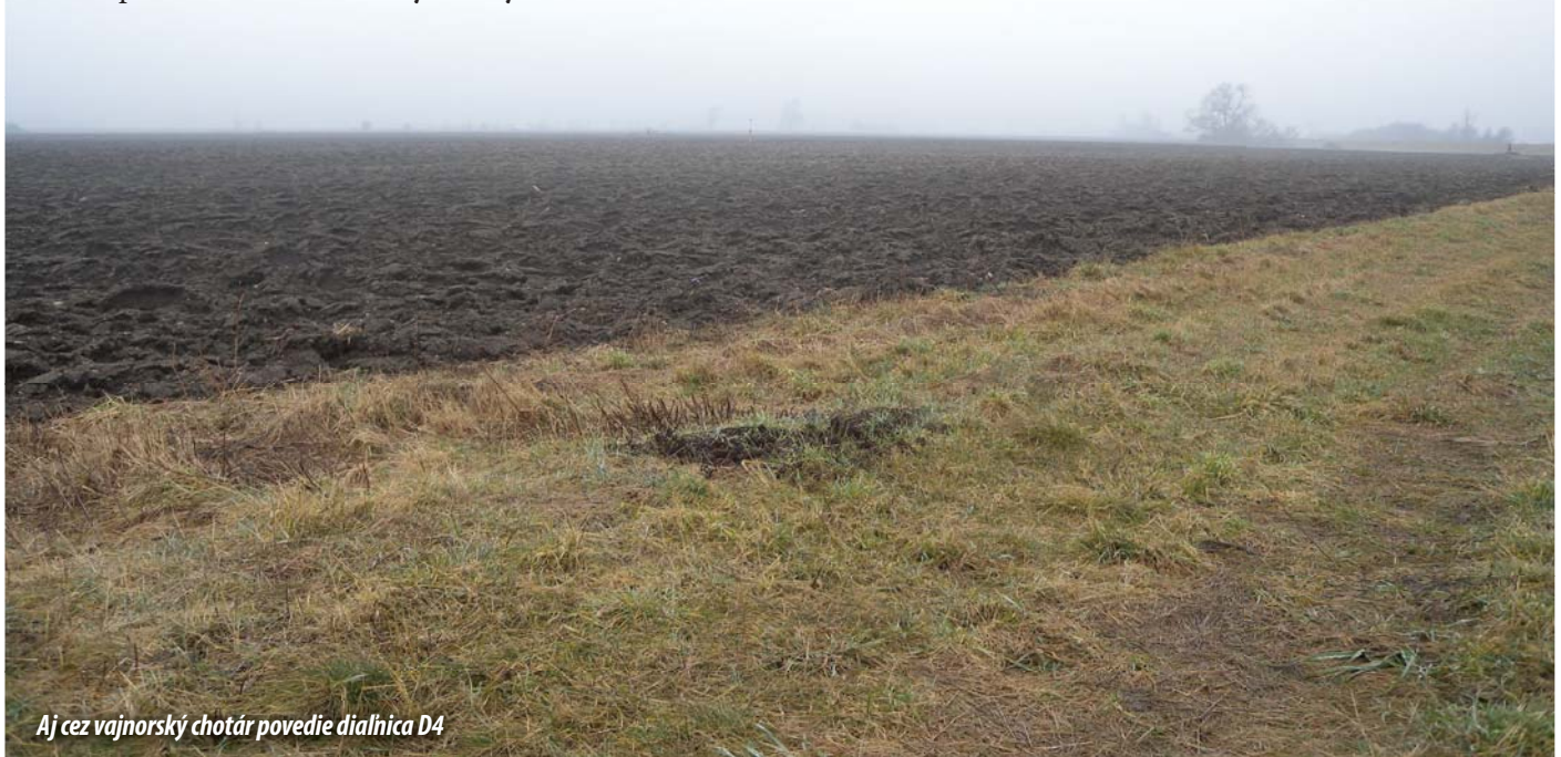
Aj cez vajnorový chotár povedie diaľnica D4

ci dotknutých pozemkov oboznámení so záberom pozemkov a s postupom pri majetkovoprávnom vysporiadaní. (VN)