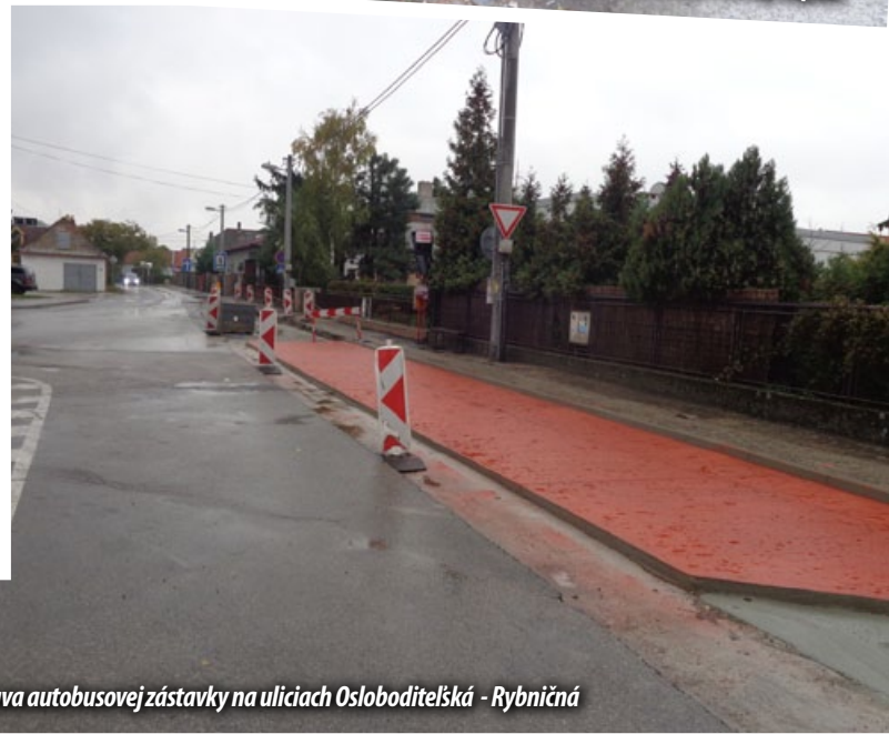
Oprava autobusovej zástavky na uliciach Osloboditeľská - Rybníčná