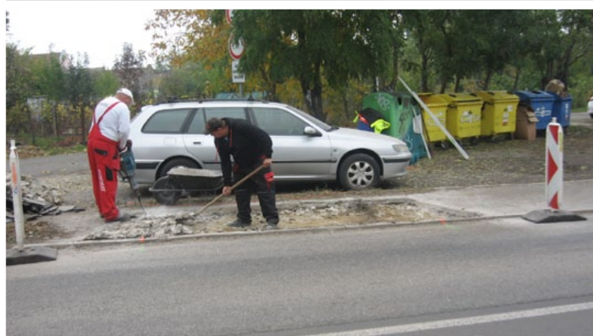
Začali sme budovať ďalšie dva prechody na ulici Pri mlyne a na Prijazdnej