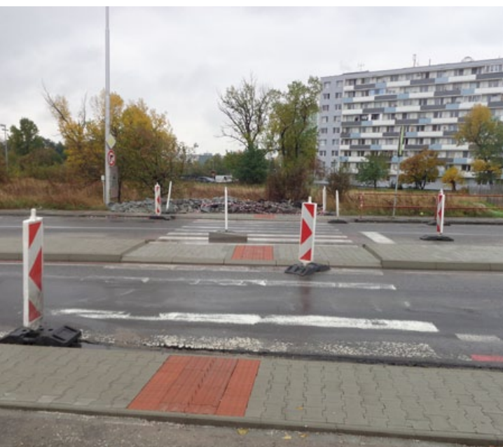
Prechod pre chodcov so stredovým ostrovčekom pri závoze BEZ