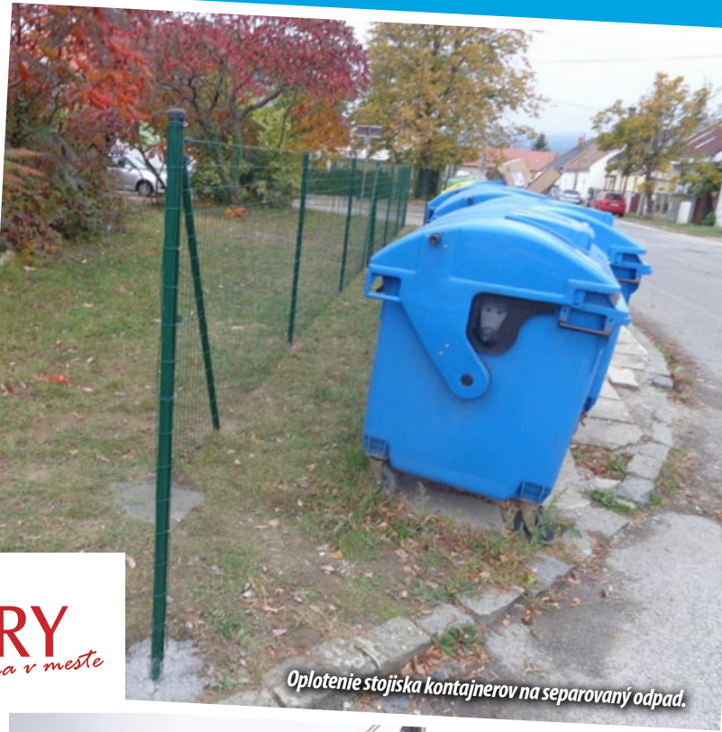
Oplozenie stojiska kontajnerov na separovaný odpad.