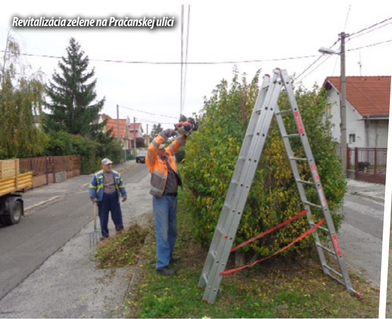
Revitalizácia zelene na Pračanskej ulici