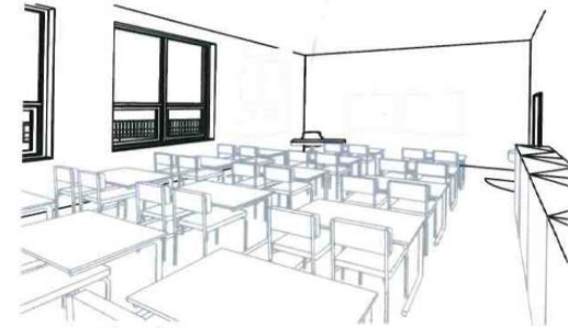
SCHEMATICKÉ 3D UČEBN