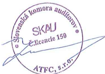
ATFC, s.r.o., Bratislava Licencia SKAu č. 150