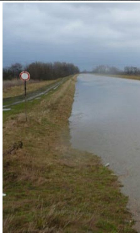
Fotoreport prinášame na s. 32