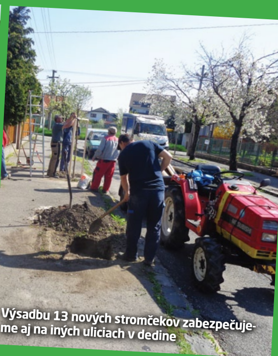
Výsadbu 13 nových stromčekov zabezpečujeme aj na iných uliciach v dedine