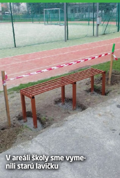
V areáli školy sme vymenili starú lavičku