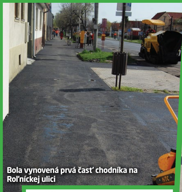
Bola vynovená prvá časť chodníka na Rolníckej ulici