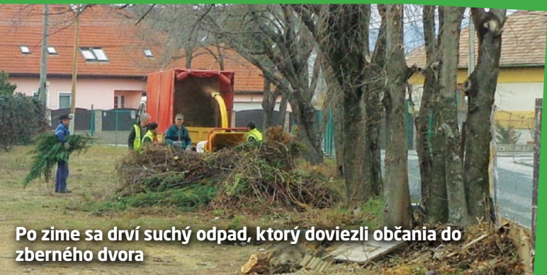
Po zime sa drví suchý odpad, ktorý doviezli občania do zberného dvora