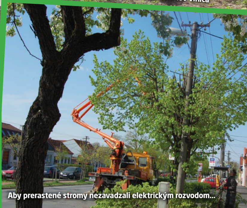
Aby prerastené stromy nezavadzali elektrickým rozvodom...