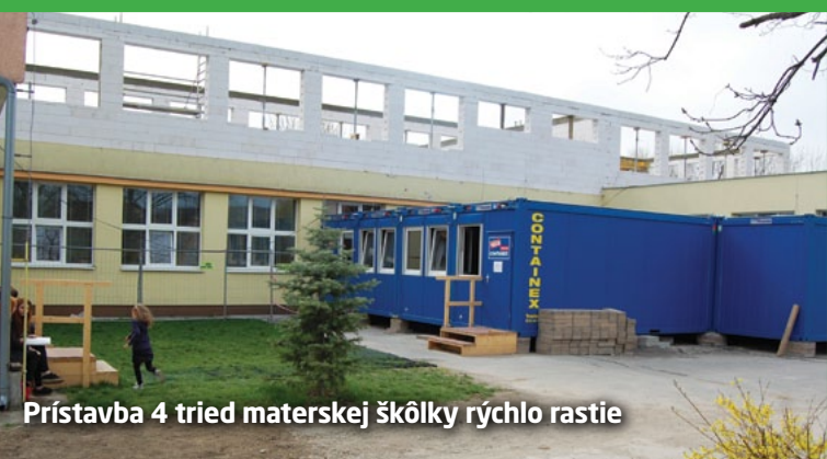
Prístavba 4 tried materskej škôlky rýchlo rastie