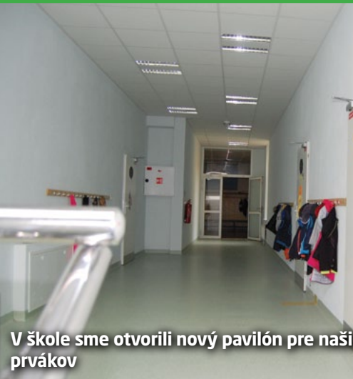
V škole sme otvorili nový pavilón pre našich prvákov