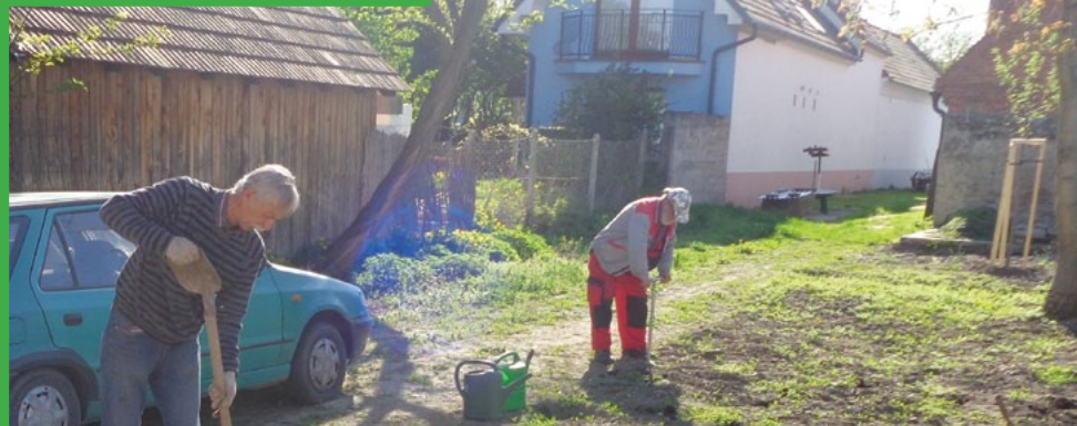
Vo Vajnorskom ľudovom dome sa sadia 50 koreňov viniča